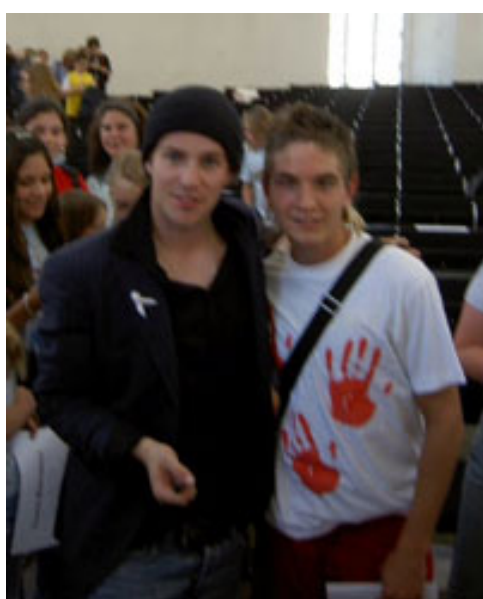
Ein Foto mit dem Popsänger Ben!

Heidemarie Wiecezoreck-Zeul, die Bundesministerin für wirtschaftliche Zusammenarbeit und Entwicklung fragte sehr intensiv nach den Aktivitäten der „Menschenrechtler“ und hatte von einigen Aktionen schon gehört.