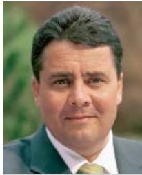
Sigmar Gabriel (SPD) ist Bundesumweltminister.