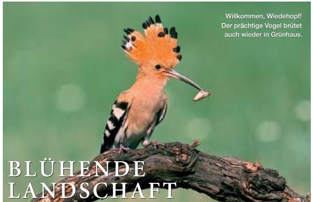
Willkommen, Wiedehopf! Der prächtige Vogel brütet auch wieder in Grünhaus.

Das Fleckchen Erde war nicht immer ein Juwel für den Naturschutz. Braunkohle wurde dort jahrzehntelang geschürft. Die riesigen Bagger fraßen sich ins Erdreich und hinterließen eine Mondlandschaft aus Gruben und Abraumphalden. Mit dem Ende des Tagebaus kehrte Ruhe ein.